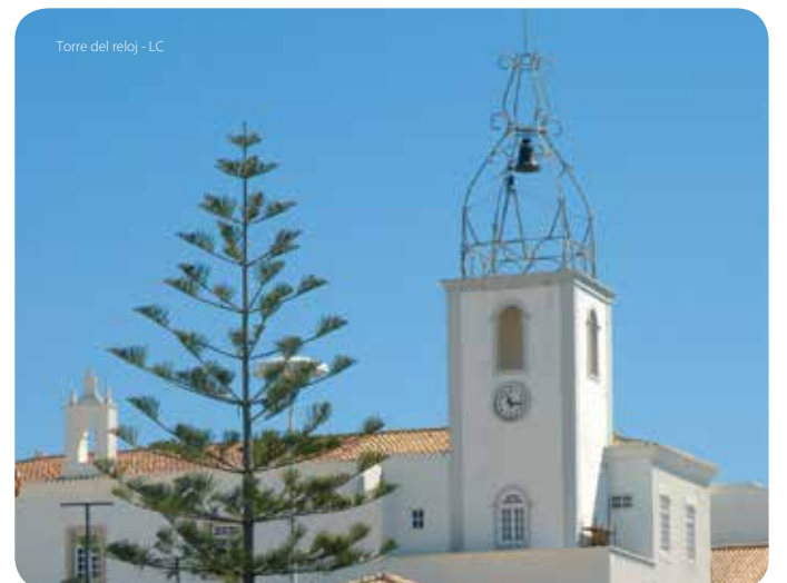
Torre del reloj - LC

Enclavada en la antigua cárcel comarcal, tiene una curiosa decoración en hierro forjado para soportar la campana.