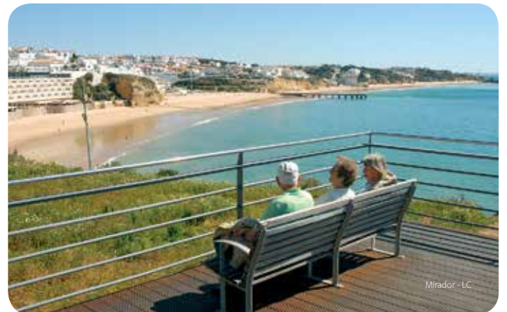
Mirador - LC