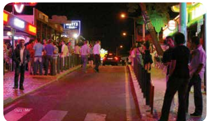
Oura - MV