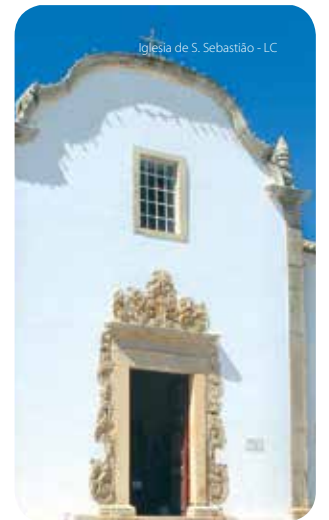
Iglesia de S. Sebastião - LC

Esta iglesia fue construida a mediados del siglo XVIII y se localiza en la Plaza Miguel Bombarda. Sus formas arquitectónicas son de inspiración popular. De su exterior, se puede destacar la cúpula y dos portales, siendo el lateral ornamentado con canterías en estilo manuelino, constituyendo un bello ejemplo de la decoración barroca. El interior es de una sola nave y presenta un retablo de madera de la segunda mitad del siglo XVIII, seis imágenes de santos, todas en madera y de autores desconocidos, y también una imagen en piedra, quizá del siglo XVI, que debía pertenecer a la antigua Ermita de Nuestra Señora de la Piedad.