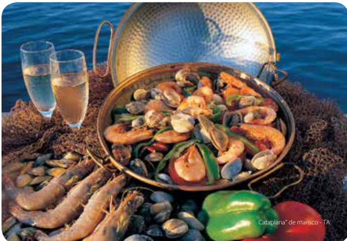
Cataplana* de marisco - TA

De los agricultores de las tierras del interior viene la cena de maíz, acompañada por carne de cerdo y embutidos, la cena de guisantes, la cabidela (guiso) de gallina y la costilla de cordero asada, a la que no faltan las almendras, la miel y el alecrín para darle un sabor inolvidable. En cuanto a los dulces, hay que elegir entre las patatas de almendra o el característico y muy dulce queso de higo.