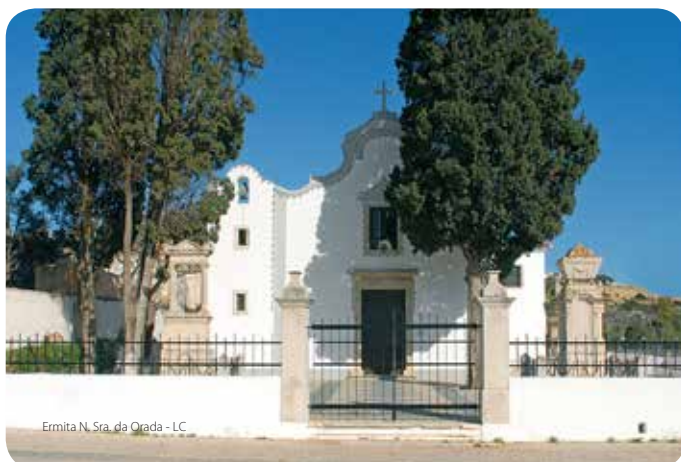
Ermita N. Sra. da Orada - LC

Típica ermita rural, construida en un valle antiguamente desierto. Lugar de devoción de los pescadores, conserva exvotos que ilustran milagros. En el atrio, dos tumbas de víctimas de las luchas constitucionales (siglo XIX).