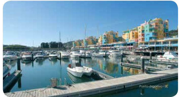
Puerto deportivo - LC