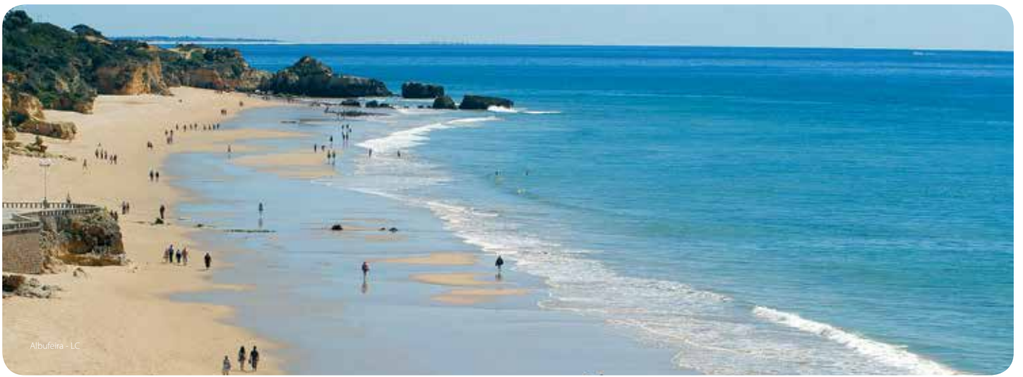
Albufeira - LC