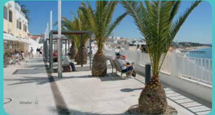
Mirador - LC