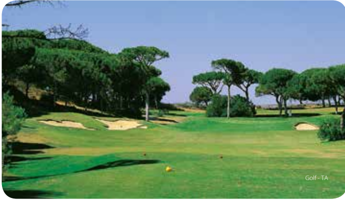
Golf - TA

¿Una reñida partida de tenis? ¿Unas horas cabalgando entre pinos perfumados? Todo esto y mucho más están a su alcance para pasar unas auténticas vacaciones de actividad.