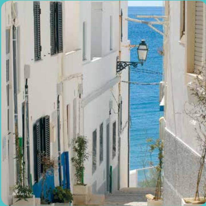
Albufeira - LC