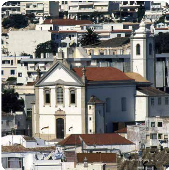
Iglesia Matriz (parroquial) - VC

Construcción de finales del siglo XVIII. Imponente campanario. Interior de una sola nave. En el altar mayor, una valiosa imagen de Nuestra Señora de la Concepción patrona de Albufeira (siglo XVIII), y un retablo pintado por el artista algarvío Samora Barros (siglo XX). En los altares laterales y en la sacristía, imágenes de los siglos XVIII y XIX.