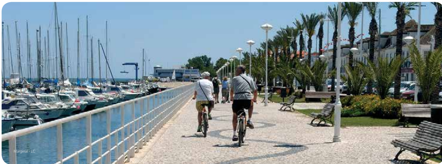
Marginal - LC