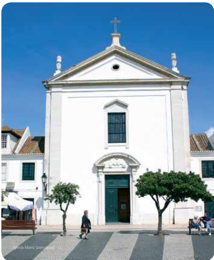
Iglesia Matriz (parroquial) - LC

Construida en el siglo XVIII, fue sometida a obras de recuperación en las décadas de los 40 y los 50 del siglo pasado. Retablos de las capillas laterales de estilo "rocaille". Buen conjunto de imágenes del siglo XVIII, destacando Nuestra Señora de la Encarnación, de la autoría del escultor Machado de Castro. Las vidrieras de la capilla mayor y de la pila bautismal, instaladas en la década de los 40, son de la autoría del pintor algarveño Joaquim Rebocho.