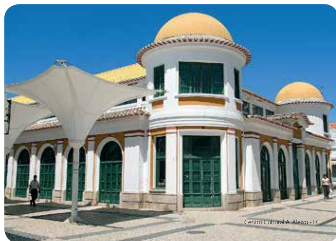
Centro Cultural A. Aleixo - LC

En el siglo XVI existía, probablemente más cerca del mar, una Vila de Santo António de Arenilha que, en el siglo XVIII, había desaparecido engullida por el mar y por las arenas. Importaba, sin embargo, controlar la entrada de mercancías por el Guadiana, colocar bajo supervisión real las pesquerías de Monte Gordo y hacer frente a España, con la que estaba en guerra en 1762/63. La construcción de Vila Real de Santo António, con evidentes ventajas económicas y políticas fue, por lo tanto, más que un puro acto de voluntad regia.