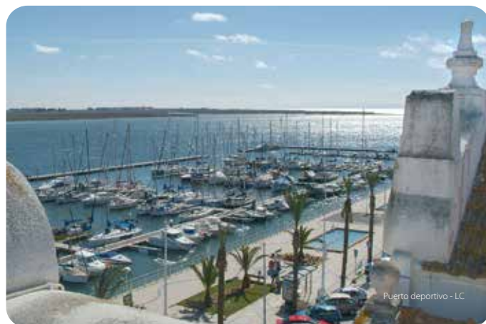
Puerto deportivo - LC

La experiencia de la reconstrucción de Lisboa tras el terremoto de 1755 fue aprovechada en Vila Real de Santo António. Primero en la planificación cuidada de la estructura urbana, facilitada por el terreno plano. Luego por la utilización de módulos arquitectónicos rígidos. Y, por último, por la prefabricación de elementos de construcción estandarizados como las canterías que vinieron de Lisboa, en barco, talladas y aparejadas para colocarlas de inmediato.