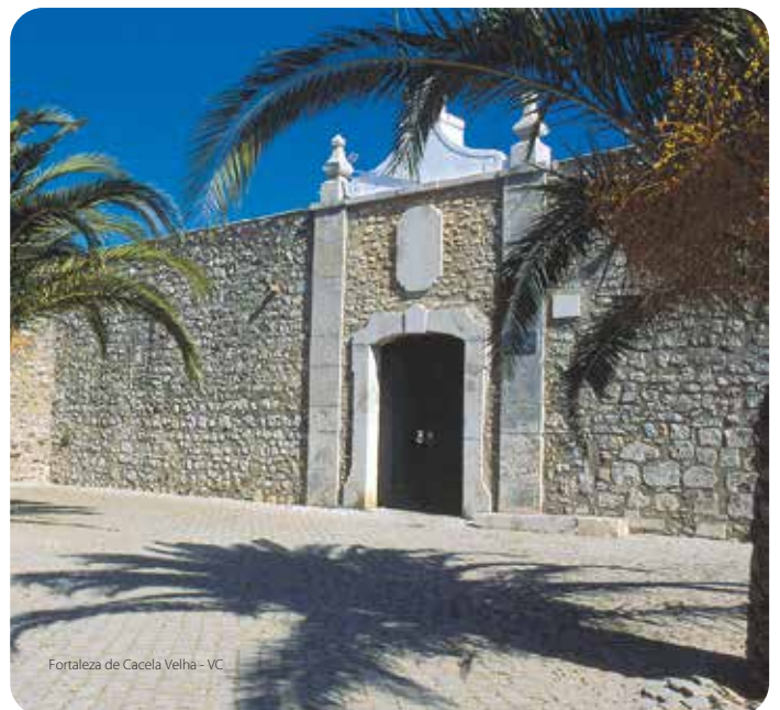
Fortaleza de Cacela Velha - VC

De forma poligonal, fue reconstruida al final del siglo XVIII.