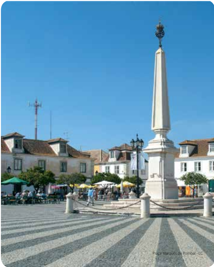
Praça Marquês de Pombal - LC

Para apreciar el plano urbanístico de Vila Real de Santo António es necesario pasear por sus calles. Es importante empezar por la Praça Marquês de Pombal, corazón de la villa, de empedrado radiante a partir del obelisco levantado en 1776. Ésta contiene tres de los principales elementos urbanos del siglo XVIII: la iglesia, el Ayuntamiento y la antigua Casa da Guarda (hoy edificio de un banco). Después deben ser recorridos algunos otros edificios, levantados ya por iniciativa particular, pero en los que es todavía visible el estilo arquitectónico. El final del recorrido lo constituyen la Línea de fachadas de la Avenida da República, delimitada por dos torreones y que contiene el edificio de la antigua Aduana, de ancho portal y frontón triangular. Se sitúa junto a los márgenes ajardinados del río Guadiana, teniendo delante la ciudad española de Ayamonte.